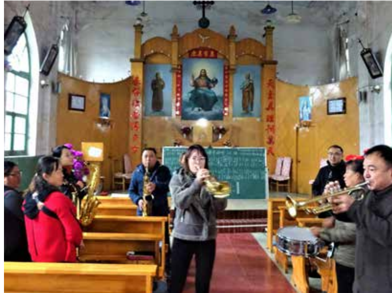
Vrolijke koperklanken in een rooms-katholieke kerk in het Chinese stadje Pingyao, zo'n zeshonderd kilometer ten zuidwesten van Peking.

REPORTAGE • In ons land krijgen we geen al te vreugdevol beeld van het functioneren van de godsdienstvrijheid in China. Toen ik dan ook enkele maanden geleden een vakantiereis door dit immens grote land maakte, nam ik me voor hiervan op z'n minst een indruk te krijgen.